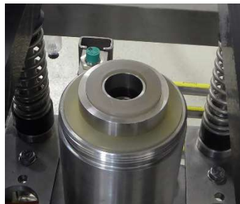
Einsatz mit Dichtung